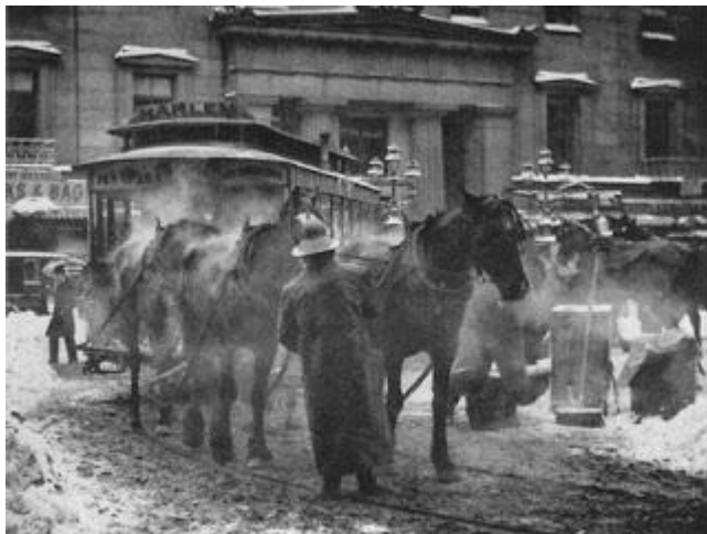
Alfred Stieglitz: The Terminal, New York (1892)